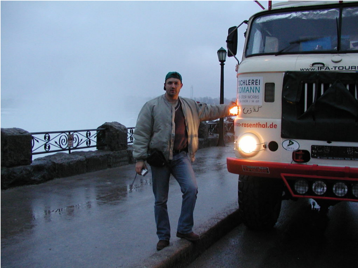
IFA W50 Tour Nordamerika