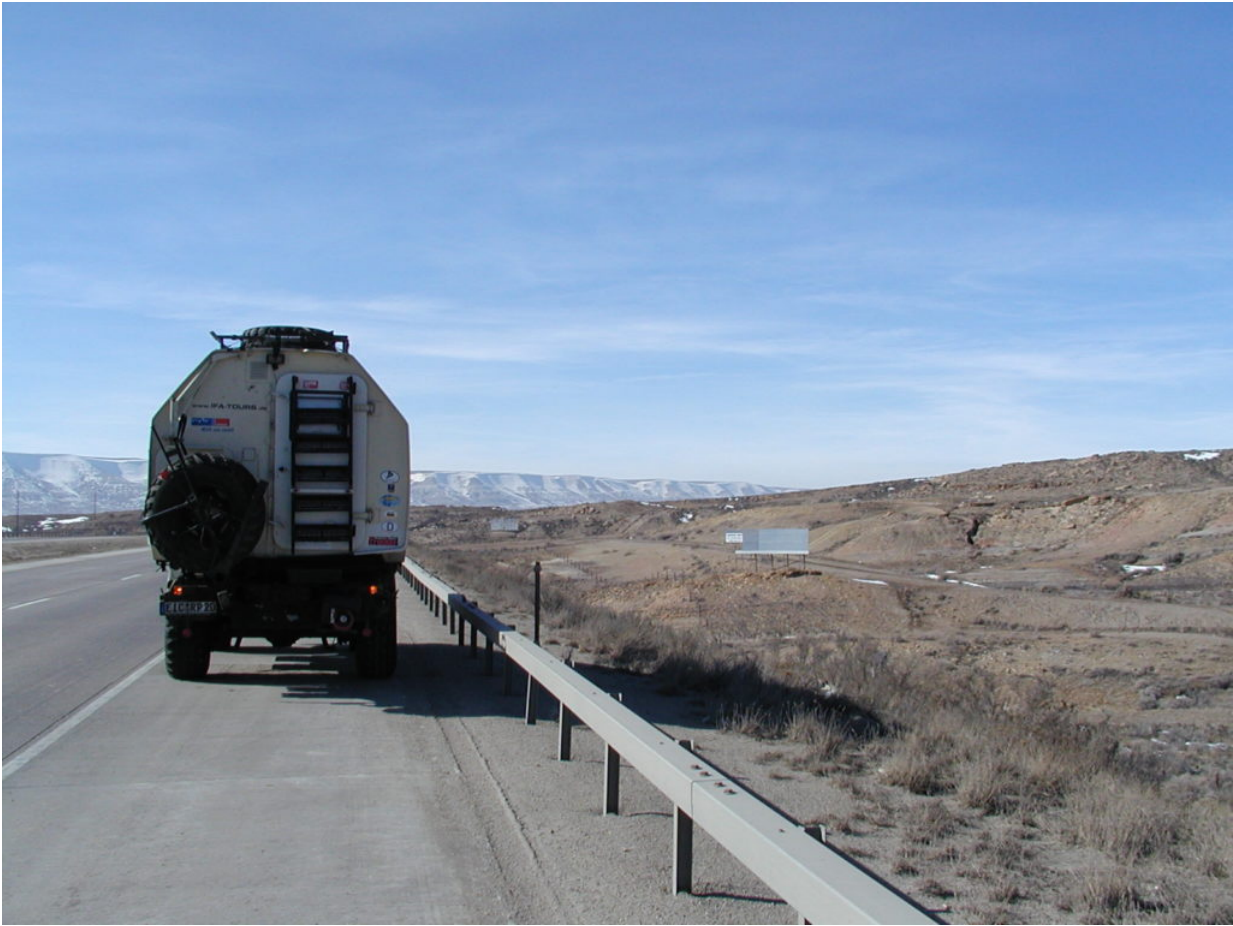
IFA W50 Tour Nordamerika