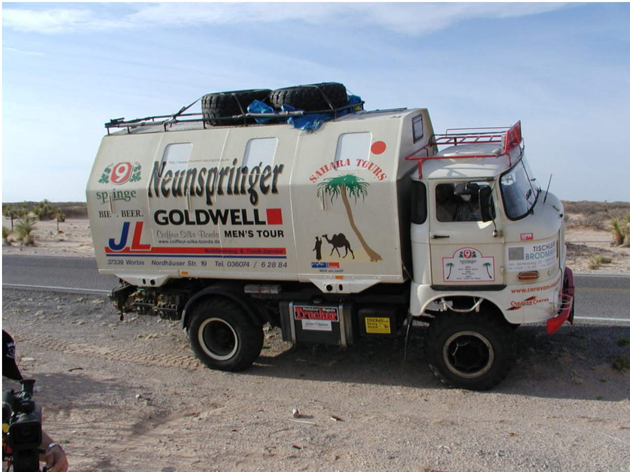
IFA W50 Tour Nordamerika, Kanada, USA, Mexiko