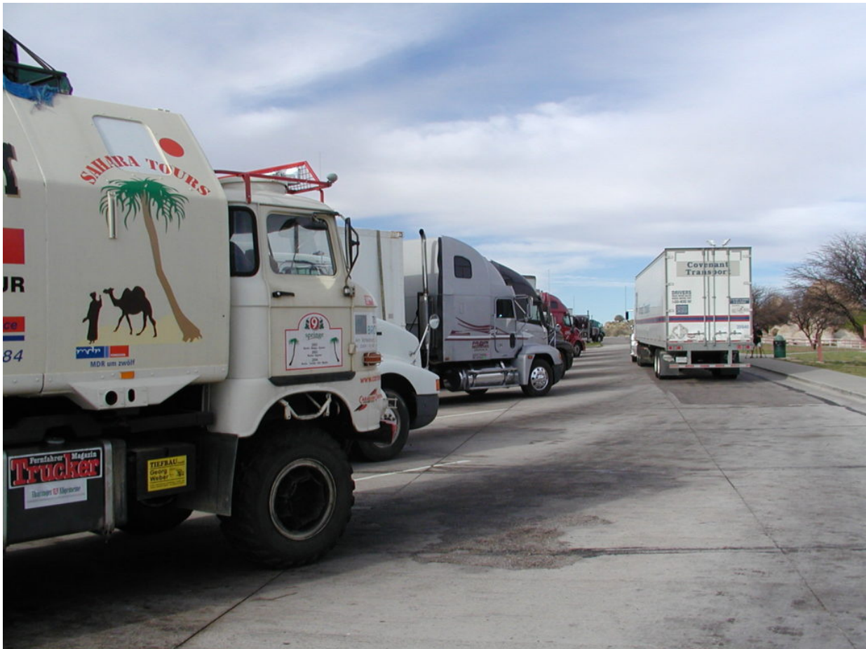
IFA W50 Tour Nordamerika, Kanada, USA, Mexiko