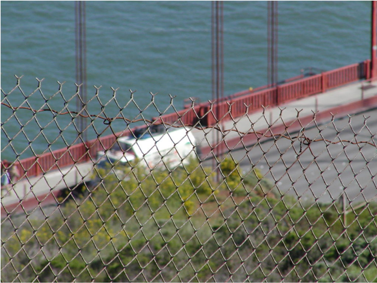
IFA W50 Tour Nordamerika, Kanada, USA, Mexiko