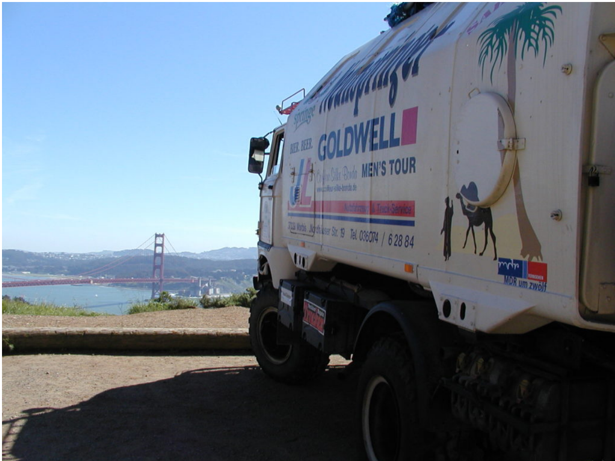
IFA W50 Tour Nordamerika