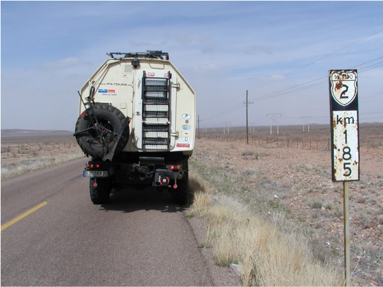
IFA W50 Tour Nordamerika