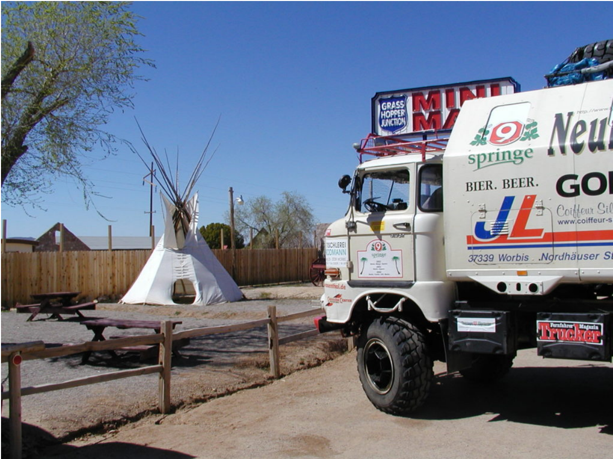
IFA W50 Tour Nordamerika