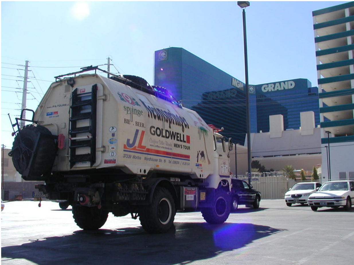
IFA W50 Tour Nordamerika, Kanada, USA, Mexiko