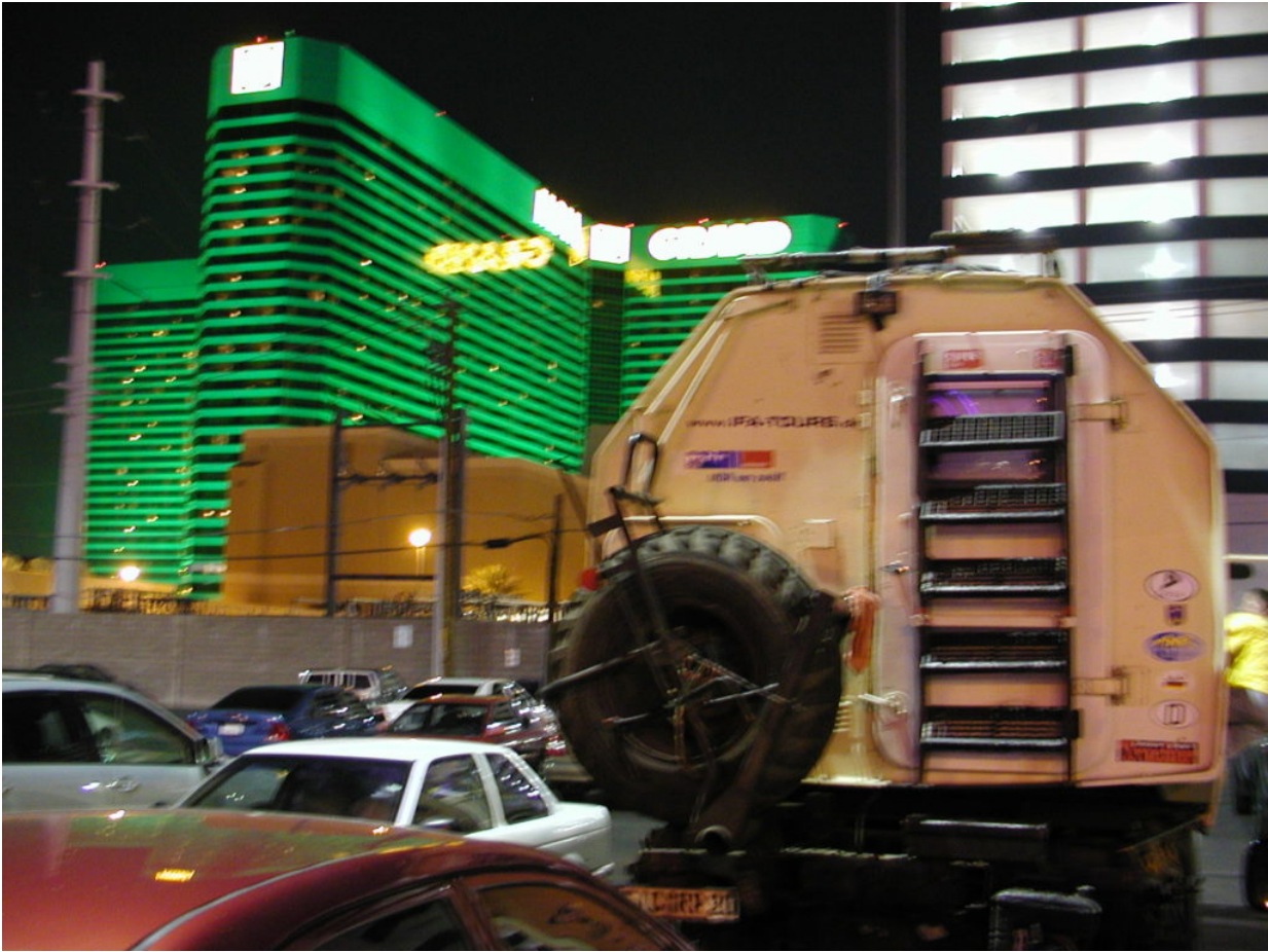
IFA W50 Tour Nordamerika, Kanada, USA, Mexiko