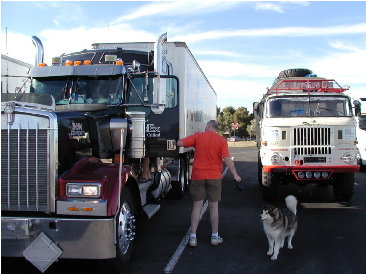
IFA W50 Tour Nordamerika, Kanada, USA, Mexiko