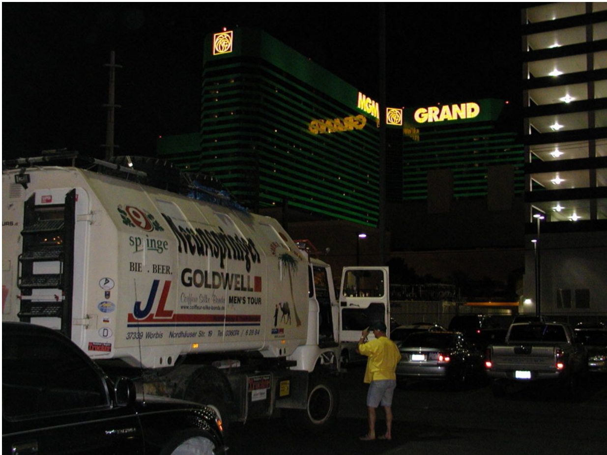
IFA W50 Tour Nordamerika, Kanada, USA, Mexiko