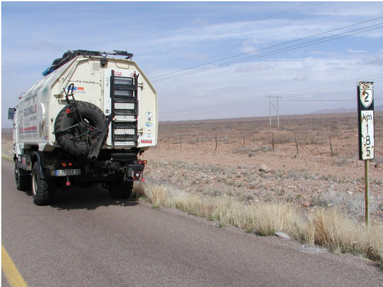
IFA W50 Tour Nordamerika, Kanada, USA, Mexiko