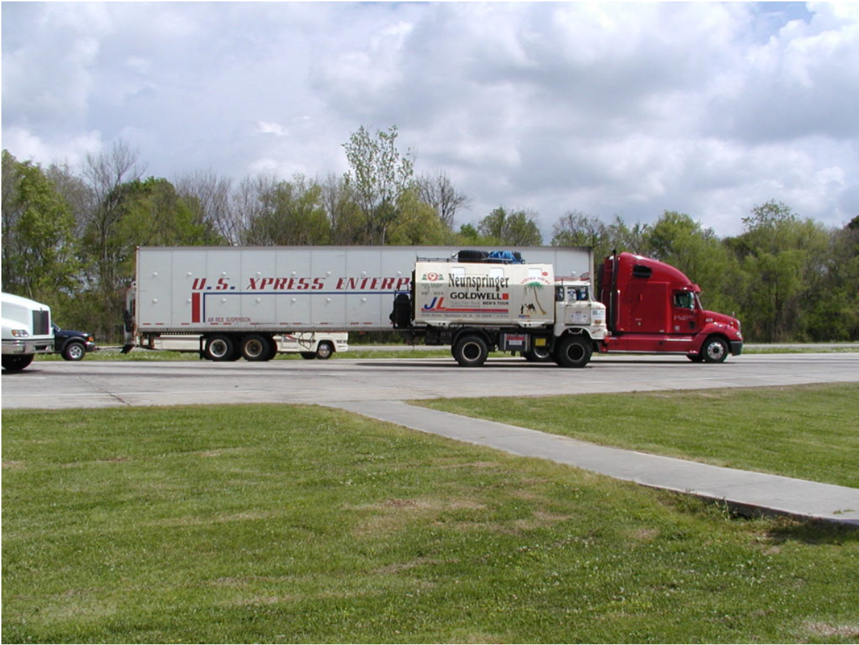
IFA W50 Tour Nordamerika