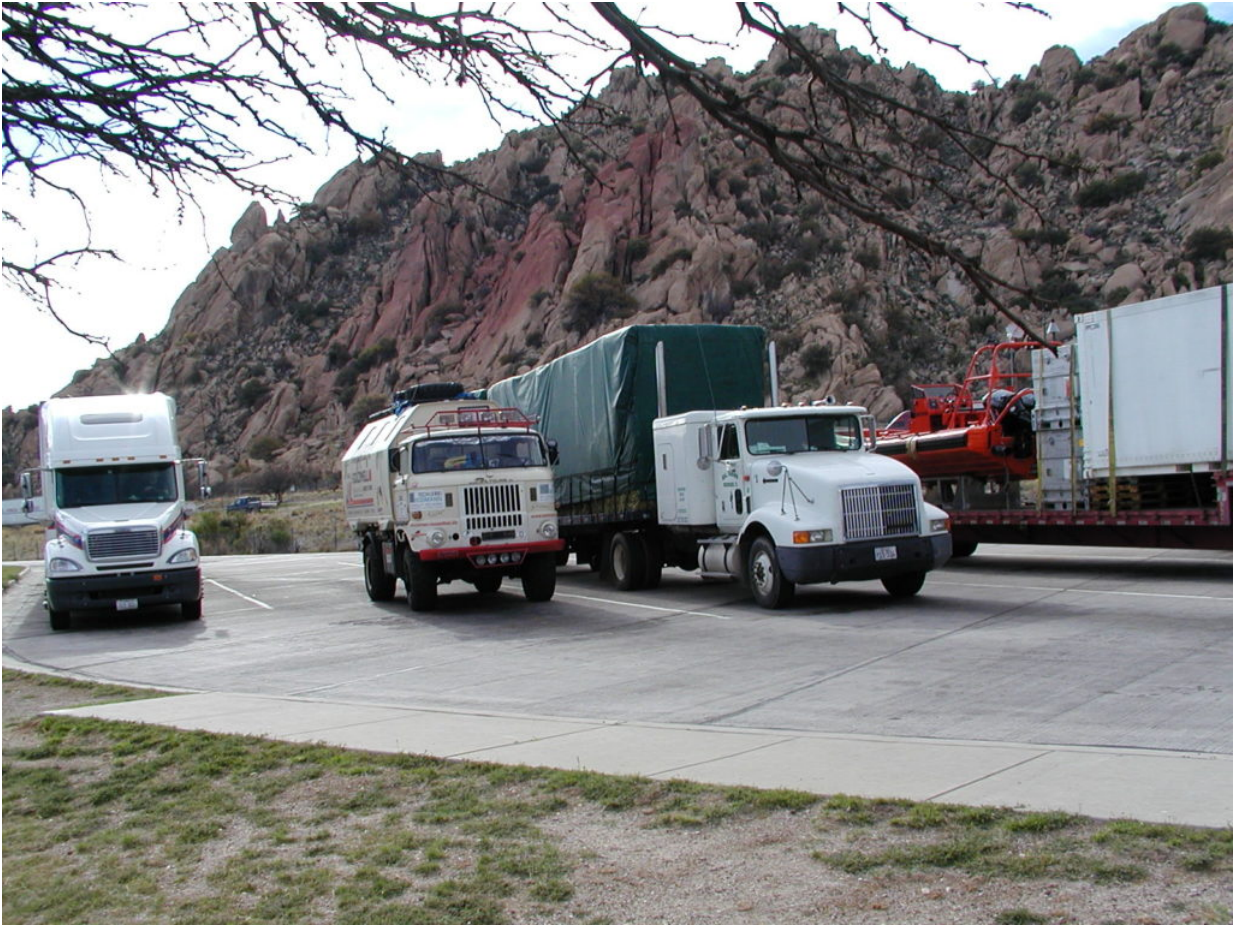
IFA W50 Tour Nordamerika, Kanada, USA, Mexiko