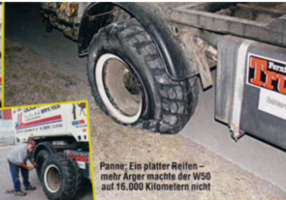
Panne: Ein platter Reifen – mehr Ärger machte der W50 auf 16.000 Kilometern nicht

Langsam zehrt die Tour an den Kräften der beiden IFA-Freaks. Das Naturschauspiel Grand Canyon lädt zu einem mehrtägigen Aufenthalt ein, bei dem sich die Abenteurer wenigstens etwas erholen können. Auf der Rückfahrt wieder Richtung Osten warten endlose Sumpflandschaften auf das Mi-