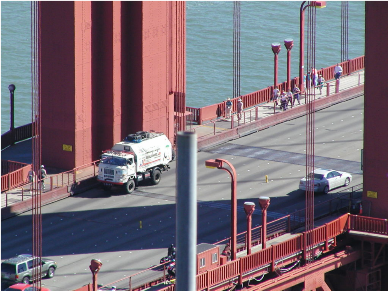
IFA W50 Tour Nordamerika