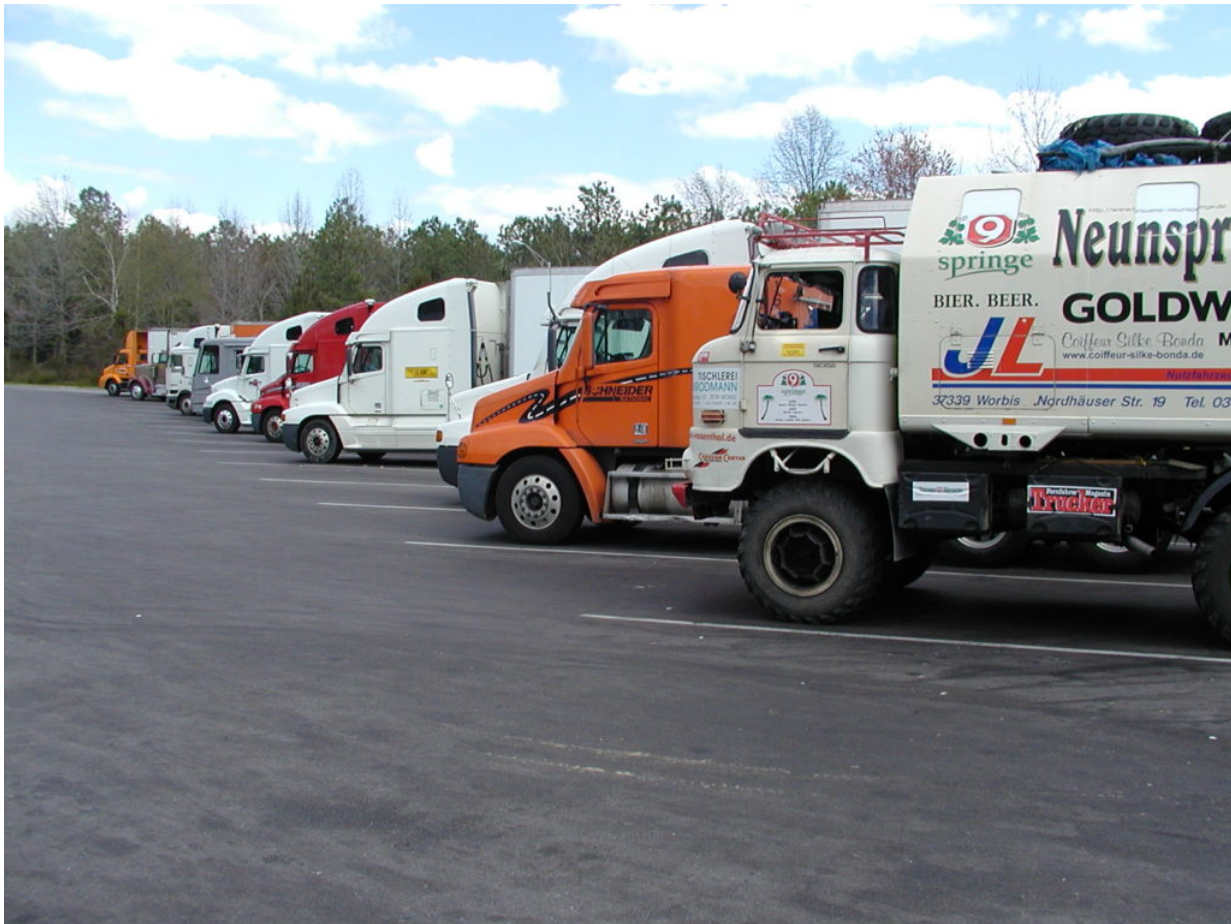
IFA W50 Tour Nordamerika, Kanada, USA, Mexiko