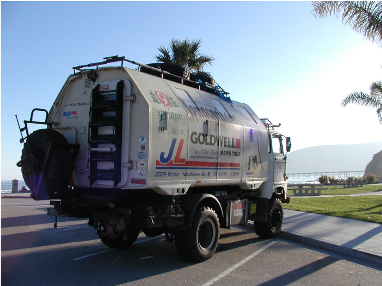
IFA W50 Tour Nordamerika, Kanada, USA, Mexiko