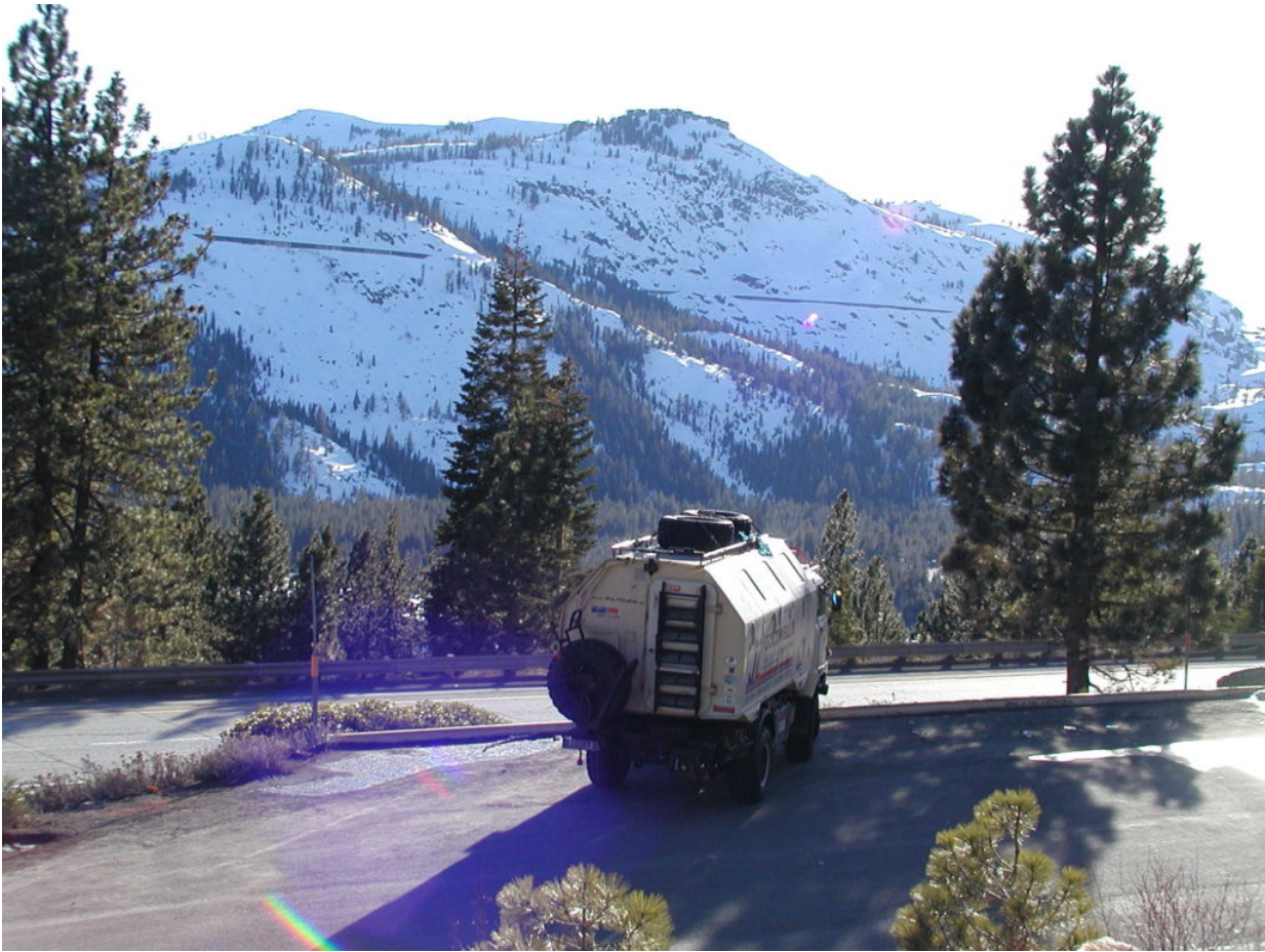
IFA W50 Tour Nordamerika