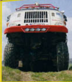
Wüste: Auf dem Weg nach Las Vegas kämpft sich der W50 mit voller Kraft durch die endlose Wüste Kaliforniens