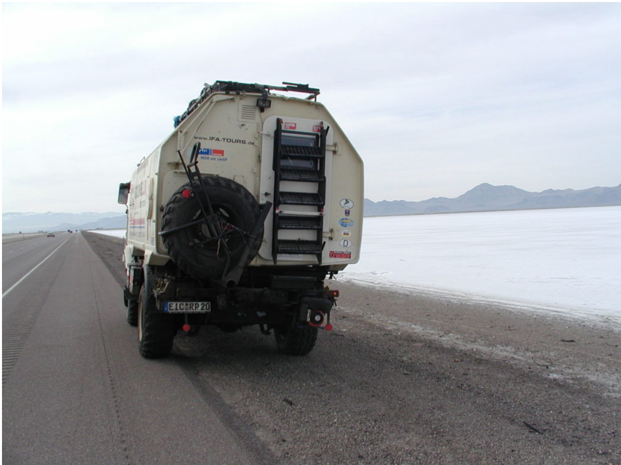
IFA W50 Tour Nordamerika