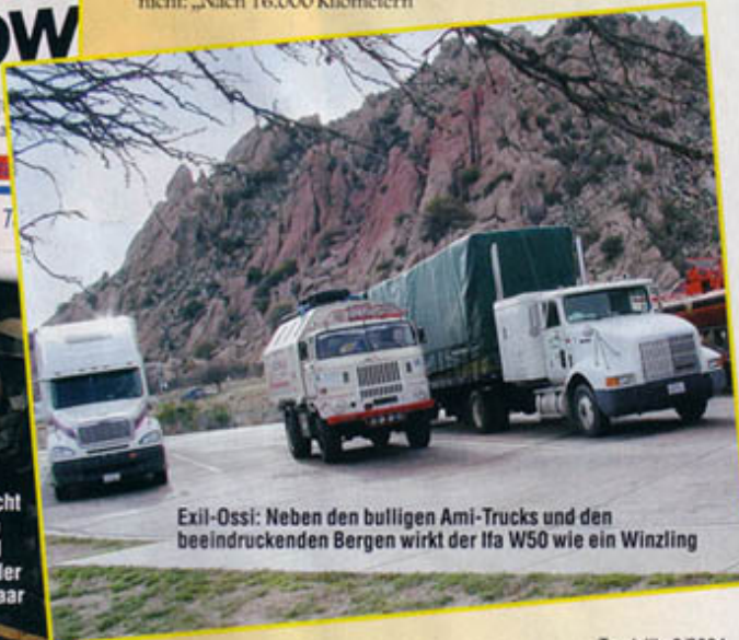
Exil-Ossi: Neben den bulligen Ami-Trucks und den beeindruckenden Bergen wirkt der IFA W50 wie ein Winzling