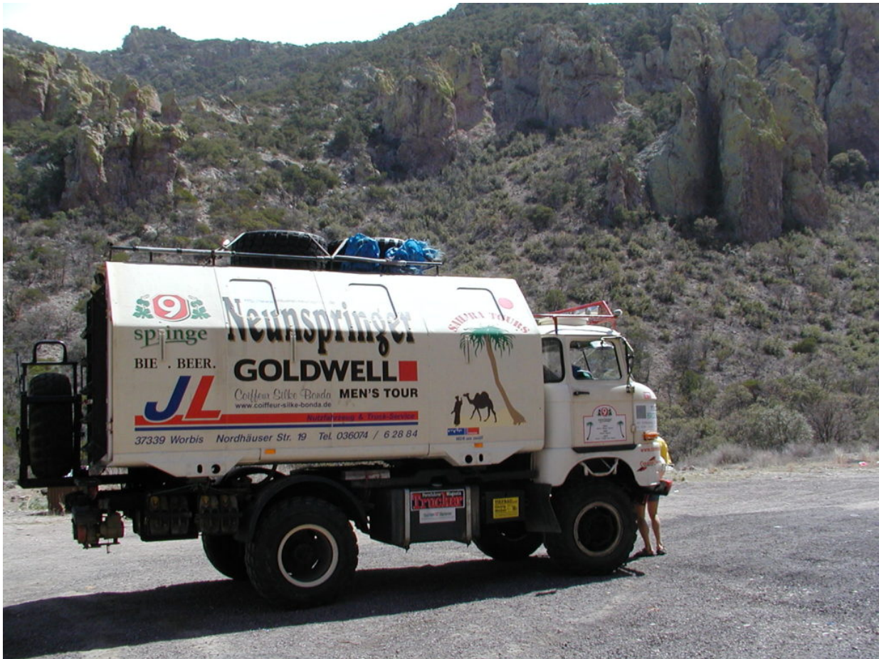
IFA W50 Tour Nordamerika, Kanada, USA, Mexiko