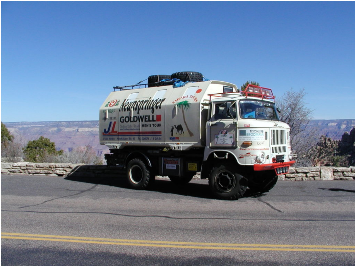
IFA W50 Tour Nordamerika, Kanada, USA, Mexiko