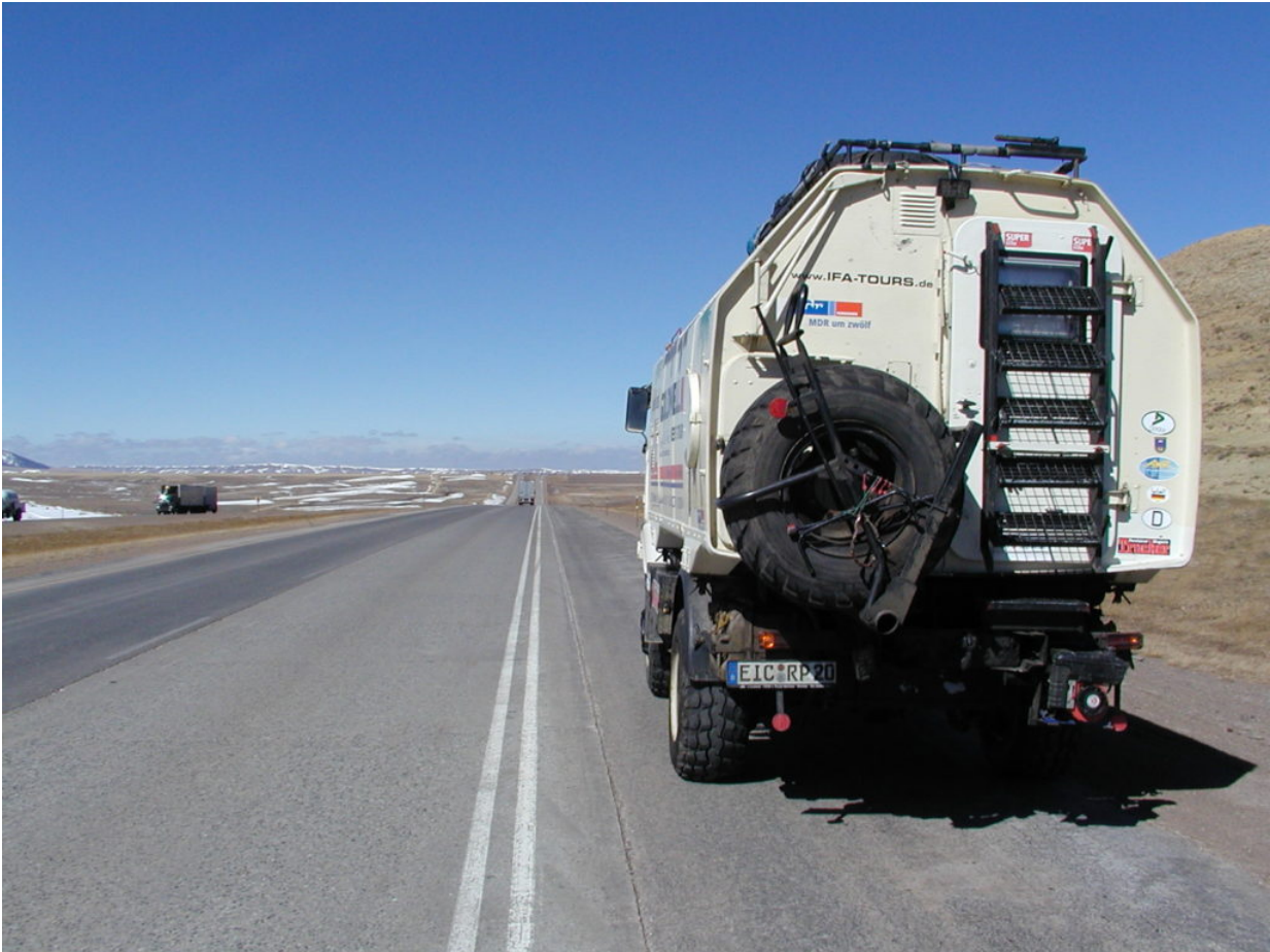
IFA W50 Tour Nordamerika