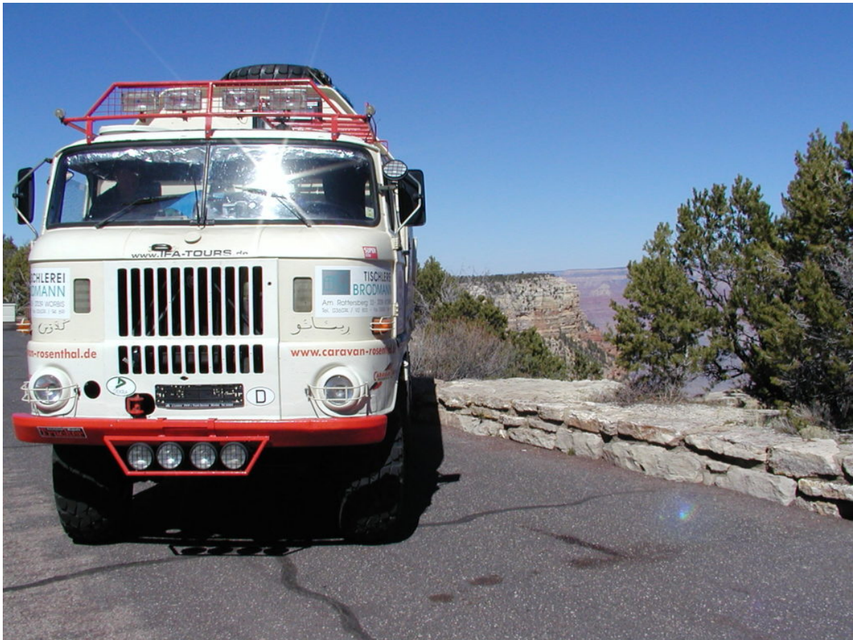
IFA W50 Tour Nordamerika, Kanada, USA, Mexiko