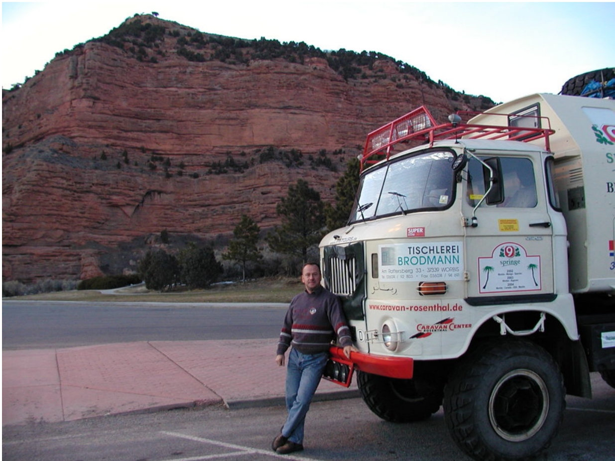
IFA W50 Tour Nordamerika