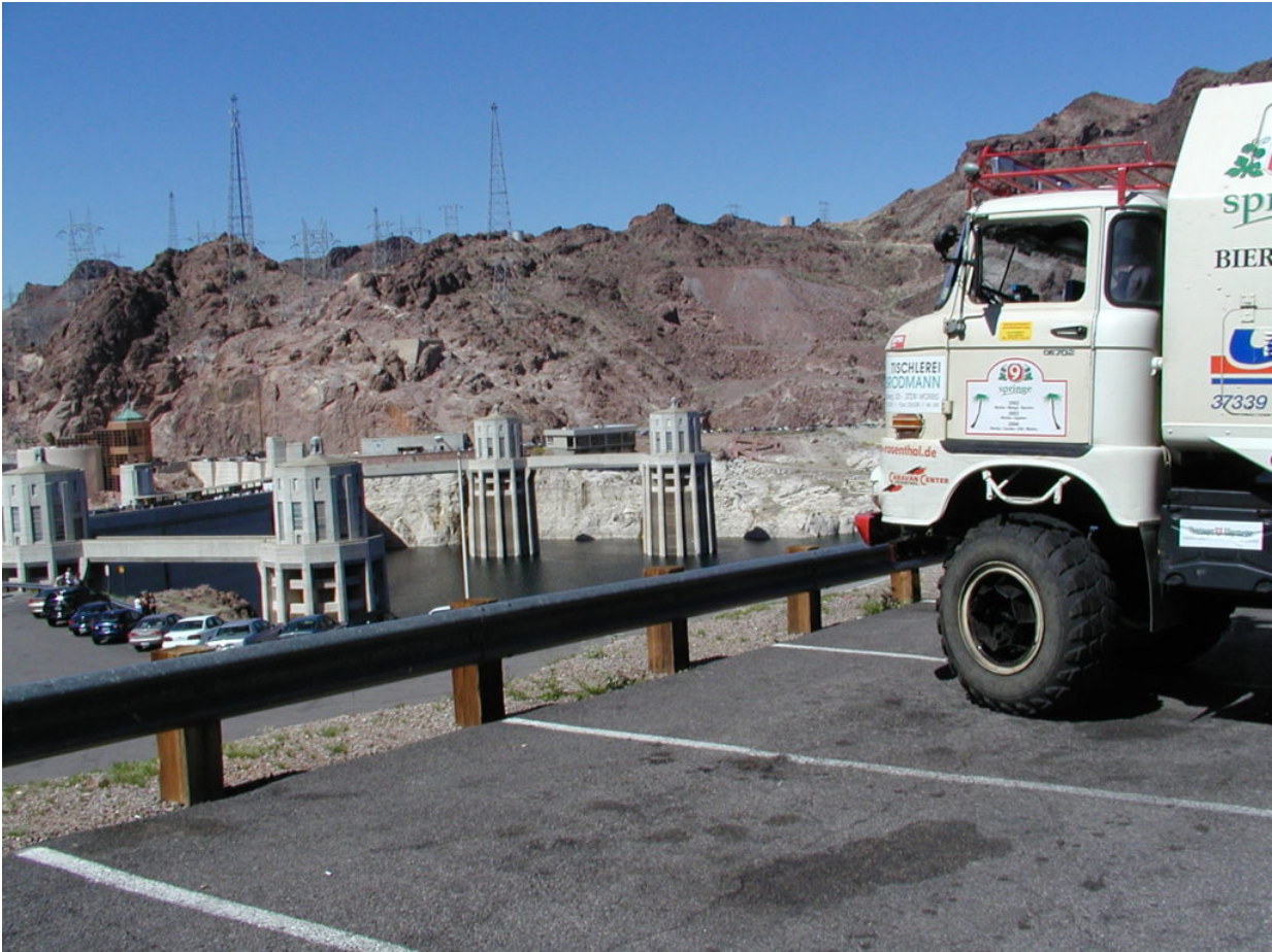
IFA W50 Tour Nordamerika