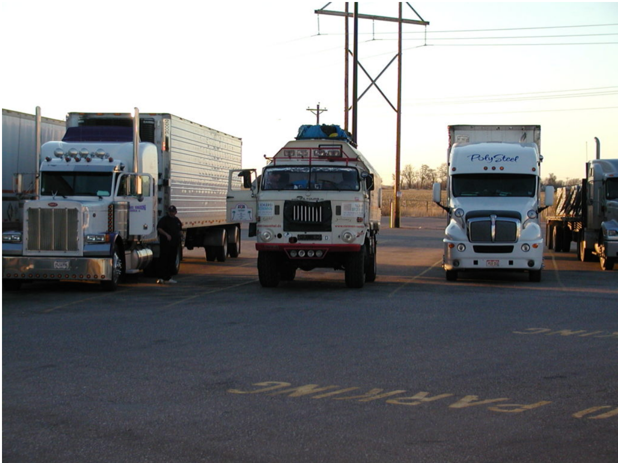
IFA W50 Tour Nordamerika