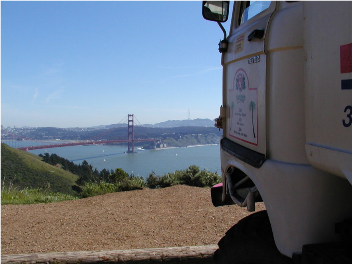
IFA W50 Tour Nordamerika