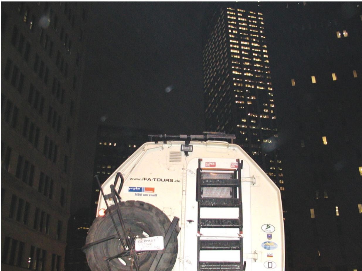
IFA W50 Tour Nordamerika, Kanada, USA, Mexiko